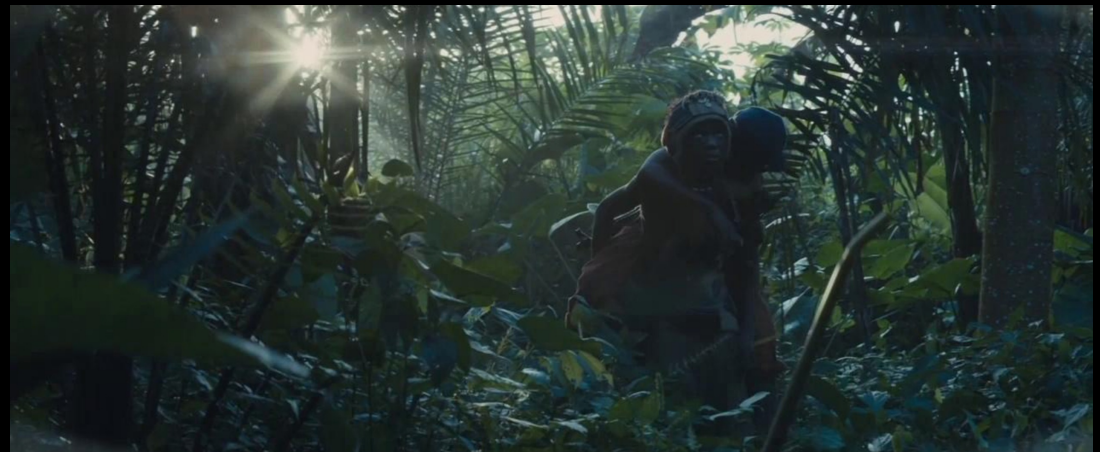
BEASTS OF NO NATION DIRECTOR CARY FUKUNAGA ©2015