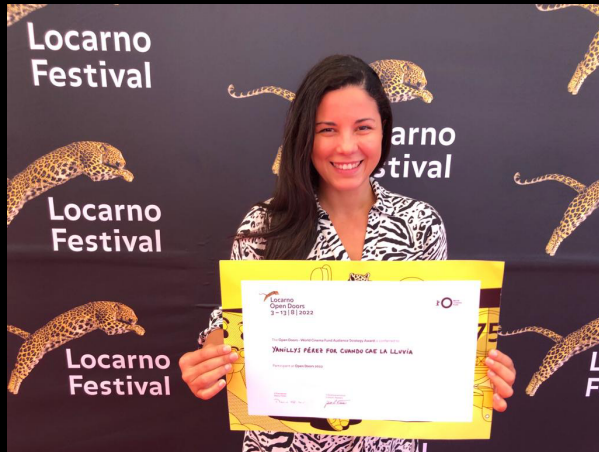
Ganadora del premio World Cinema Fund Audience Strategy para "Cuando Cae La Lluvia", en el Festival de Locarno, Open Doors 2022.