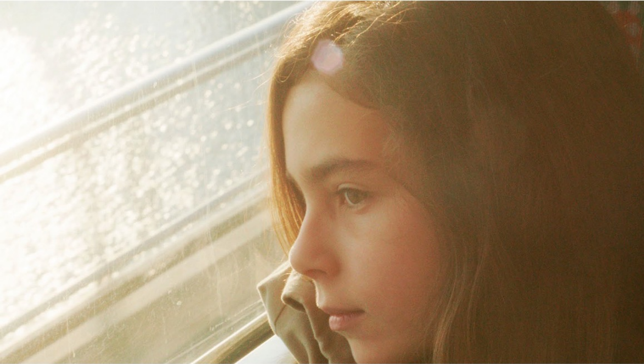
MUSTANG DIRECTOR DENIZ GAMZE ERGÜVEN ©2015